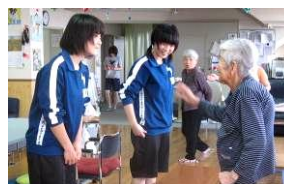
笑顔がうれしかったな 蒲郡市立塩津中