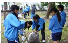
きれいになったね あま市立七宝北中