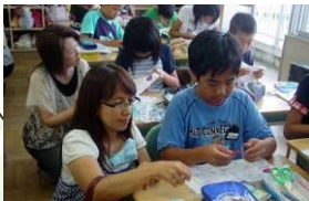
授業参観、面白かったね 安城市立錦町小