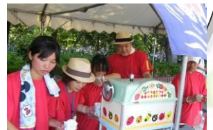
お客様の笑顔がうれしいな 碧南市立中央中