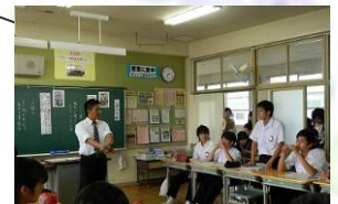
そんな見方もできるんだね 稲沢市立明治中