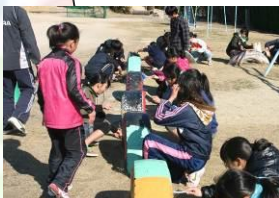
みんな喜んでくれるかな 東郷町立春木台小