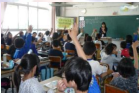
もっと意見を言いたいな 豊川市立東部小