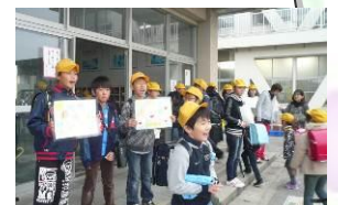
あいさつは玩気ができるね 阿久比町立南部小