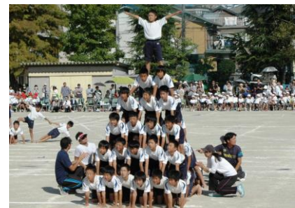
【1・2年「トッキュウジャー」】 【3・4年「ソーラン節」】