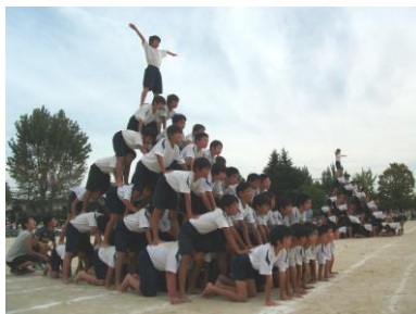
【5・6年「仲間を信じて」】