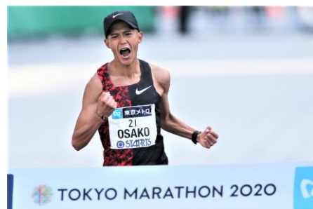
大迫 傑 選手

3月1日(日)に開催された東京マラソン2020(42.195km)において、大迫傑選手は2時間5分29秒という日本新記録を出し、見事に東京オリンピック日本代表選手となりました。9月に開催されたMGC(マラソングランドチャンピオンシップ:代表枠2名)では3位となり、代表選手にはなれませんでした。その時に「何が足りなかったのか?」自問自答したそうです。「まず、最初に自分の『心』を変えなければいけないと思い、練習拠点を環境の整ったアメリカから厳しい環境のケニアに変えました。そこで、生活習慣も練習メニューも変え、日々精進した成果だと思います。」と振り返っていました。