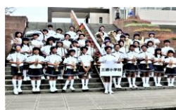
〈ファンファーレバンド部〉