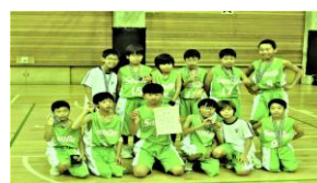
〈男子ミニバスケットボール部〉