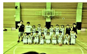
〈女子ミニバスケットボール部〉