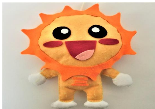
<三郷小人権キャラクター>

三郷小学校 校歌 石井 谷口 巖 作詞 歎 作曲 一 両手を広げ 仰ぎ見る 空は 三百六十度 山の向こうに 何がある 風が行く度に 何がある 遠く湧き立つ 白雲に ぼくらは 未来の夢を追う 二 足音高く 土踏めば こだまは響く 何千里 丸い地球の 西東 はるか世界の 友も呼ぶ 歌おう共に 声あわせ ぼくらは 平和の世を誓う 三 猿投の山よ 矢田川よ 時は流れて 幾世紀 森の泉を 手に汲んで 荒れ野開いた 先祖たち 努めて止まぬ 学び舎に ぼくらは 歴史を継いで立つ