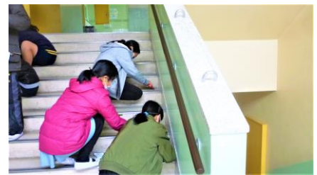
自ら進んで階段すみのよごれをとる子どもたち

そこで、冬休み前に全校の子どもたちに、夢を言葉や絵で自由に書いてもらいました。何も書けない子がいるのではと思っていましたが、ほとんどの子どもたちがしっかりと「将来なりたいもの」などを書いていました。たくさんのよい夢があるのですが、その中で一つの夢を紹介します。