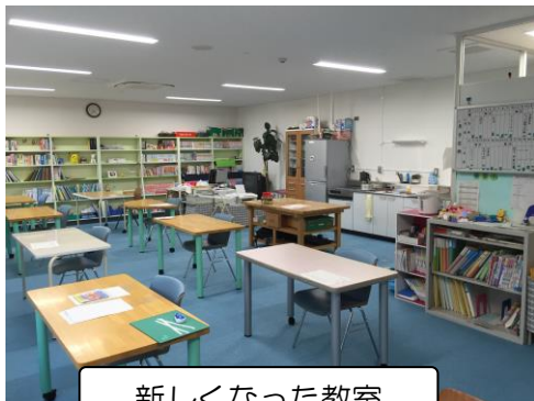
新しくなった教室

◎「つくしんぼ」は、心に悩みを抱え学校に通えなくなった児童・生徒が自立と学校復帰を目指すための教室です。自学自習したり体験活動したりして心のパワーを充填する場所です。