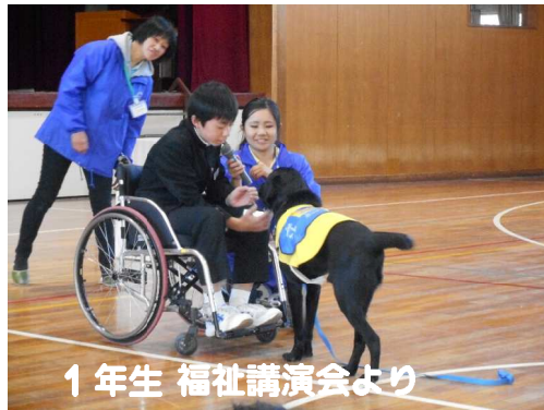
1年生 福祉講演会より

「We Love東中新聞（はがき新聞）」 校区の小学校に三年生の作品を掲示してもらいました。様々な視点からまとめ、中学校生活が楽しく充実していることを伝えてくれました。新一年生の抱いていた不安や疑問を期待や喜びに変えてくれたことと思います。母校に誇り（プライド）をもった生徒が多く、たいへんうれしく思います。