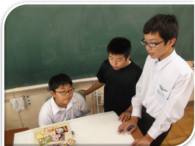
文化祭準備の様子