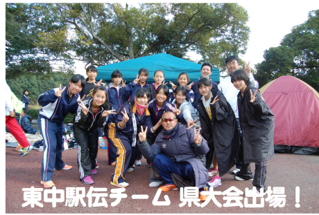
東中駅伝チーム 県大会出場！

今年も残すところあとわずかになり、二学期の終業式が間近に迫ってきました。大きな行事がいっぱいな中、東中フェスティバルを中心に、素晴らしい成果を修めることができたと思います。節目となる年の瀬にあたり、皆さん一人ひとりが、自らの生活の様子や取組の姿を振り返り、自分の弱点や至らなかつた部分を克服し、よりよい三学期がスタートできるようなしてきたいと思います。