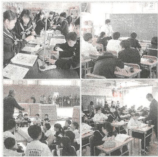
授業風景「主体的・対話的で深い学び」