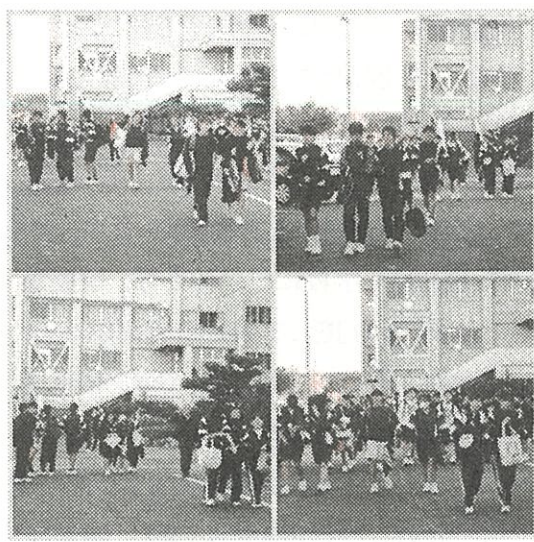
下校風景「さようなら」「また明日」