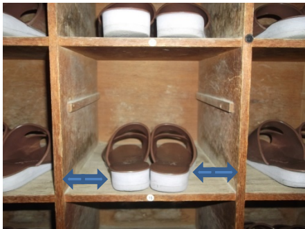
左右のげた箱の壁との距離を整える