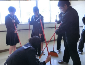
感心していました！