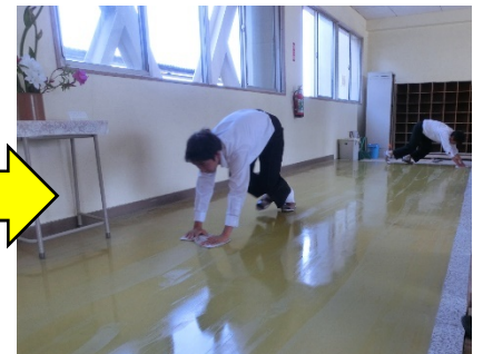
雑巾がけまできれいになりました