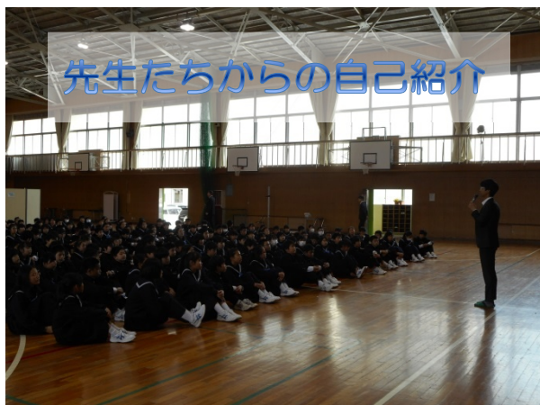
先生たちからの自己紹介

昨日の学年集会では、1年の先生から自己紹介がありました。印象に残っている先生はいましたか？まだまだこれからたくさんの先生と部活や授業で交流をしていきたいと思います。そんなとき、昨日の集会の時のように、姿勢良く、話している人の方に体を向けて話を聞くことができると、とても良い印象が得られるはずです。また、授業の時や朝や帰りに大きな声であいさつができると、お互いに気持ちよく過ごすことができます。同じ1日なら、中身の濃い充実した1日にしていきたいですね。