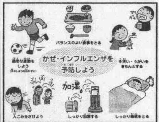
↑県健康推進課、インフルエンザ予防画像より