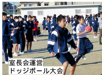
室長会運営 ドッジボール大会