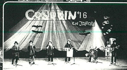
フォルクローレの音楽を演そうするお祭り (福島県伊達郡川俣町)

8分の6拍子…25ページ フォルクローレ…41ページ フレーズのくふう…25ページ