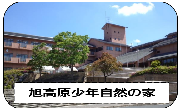
旭高原少年自然の家

学習と生活のまとめをしっかり行い、元気で夏休みを迎え、林間学校に出発できるよう、子どもたちに声をかけていきます。夏休み中も体調管理、そして『交通安全』には十分留意してください。有意義で心に残る休みを過ごし、9月1日(金)には全員元気で再会し、2学期がスタートできることを願っています。