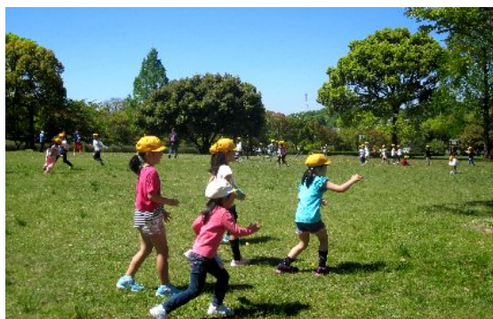
1・2年生 小幡緑地 公園

4月28日に予定しておりました遠足ですが、好天に恵まれ予定通り実施することができました。日差しは強かったのですが、日陰に入ると心地よく遠足には絶好の日でした。子どもたちは、とても楽しそうに過ごしていました。