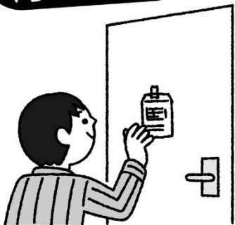
ようき とびら は 容器をトイレの扉に貼っておく