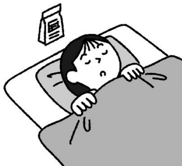
ようきまくらもと お 容器を枕元に置いておく