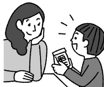
かぞくひと はな 家族の人に話しておく