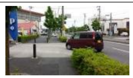
【危険箇所：アスカへの出入り口】

P T A生徒指導部よりお願いしました通学路点検の提出ありがとうございました。例年よりもたくさんの危険箇所を指摘していただきました。現地に出かけ、登下校の様子等を見ながら、16カ所の改善要望を市の方に提出しました。ご協力ありがとうございました。