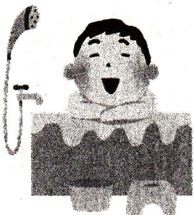
体をきれいにしよう