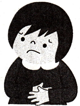
体調を確認しよう

★フール学習は、いつもより体力を使います。今からしっかり体調をととのえておこう！