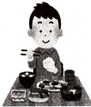
ごはんをしっかり食べよう